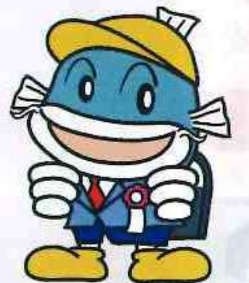
滋賀県イメージキャラクター キャッピー