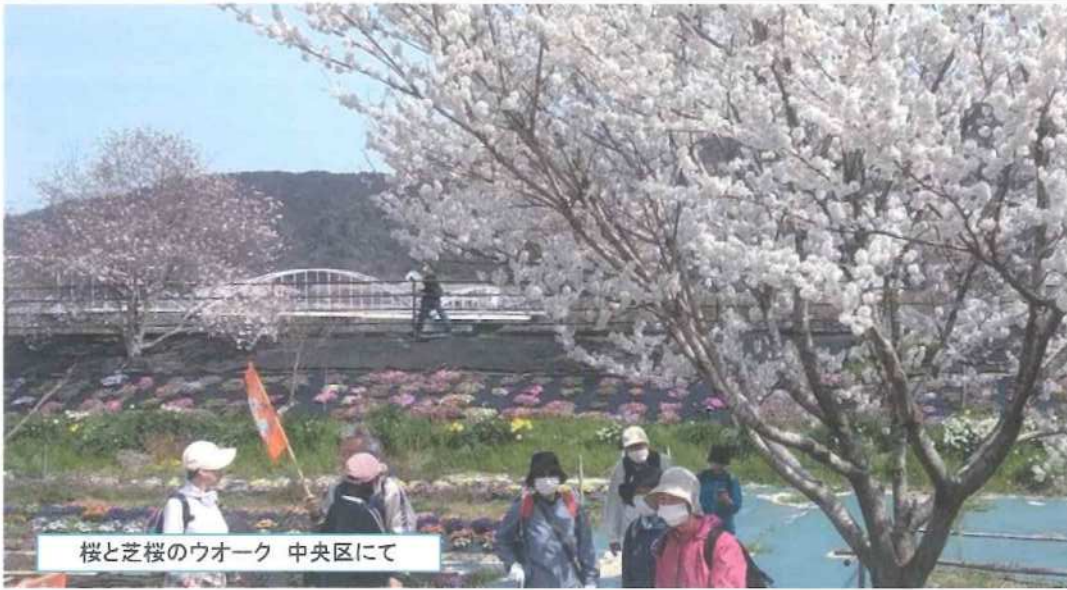
桜と芝桜のウォーク 中央区にて