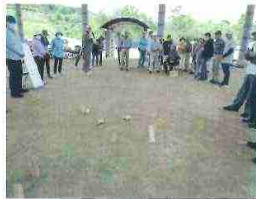
ニュースポーツ「モルック」