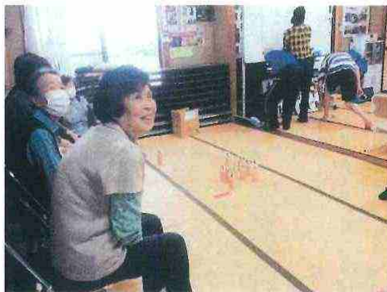
正楽寺老人会で実施