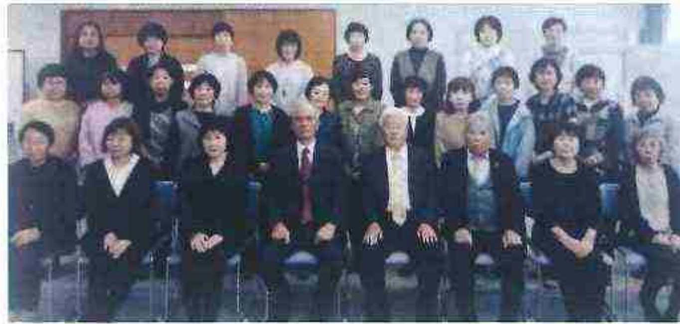
女性委員の皆さん