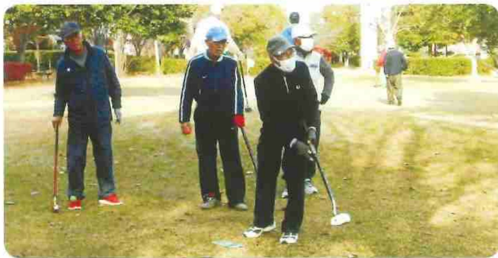
R5.09.14(木) 第2回グラウンドゴルフ大会