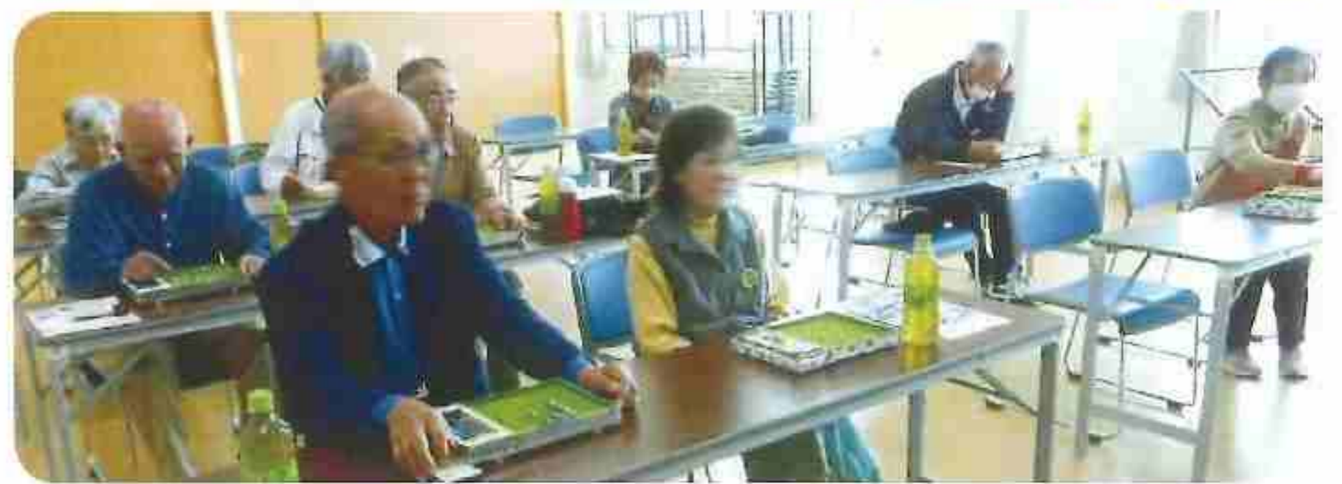
R5.10.09(木) 脳トレで認知症予防