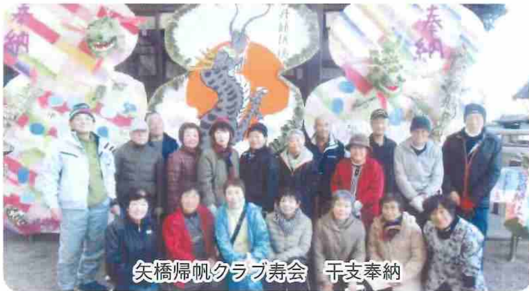
矢橋帰帆クラブ寿会 干支奉納

ね、巨大絵馬は3枚に分け、1枚の高さ3メートル、横2.5メートルの六角形で、竹の骨組みに和紙や色紙を貼り、竜の絵や竜の造形作品に木の葉を貼り付ける作業を行い、結果年末に完成し、神社に奉納することができました。新年の初詣にて会員や町民の方々に見ていただきました。(矢橋帰帆クラブ寿会)