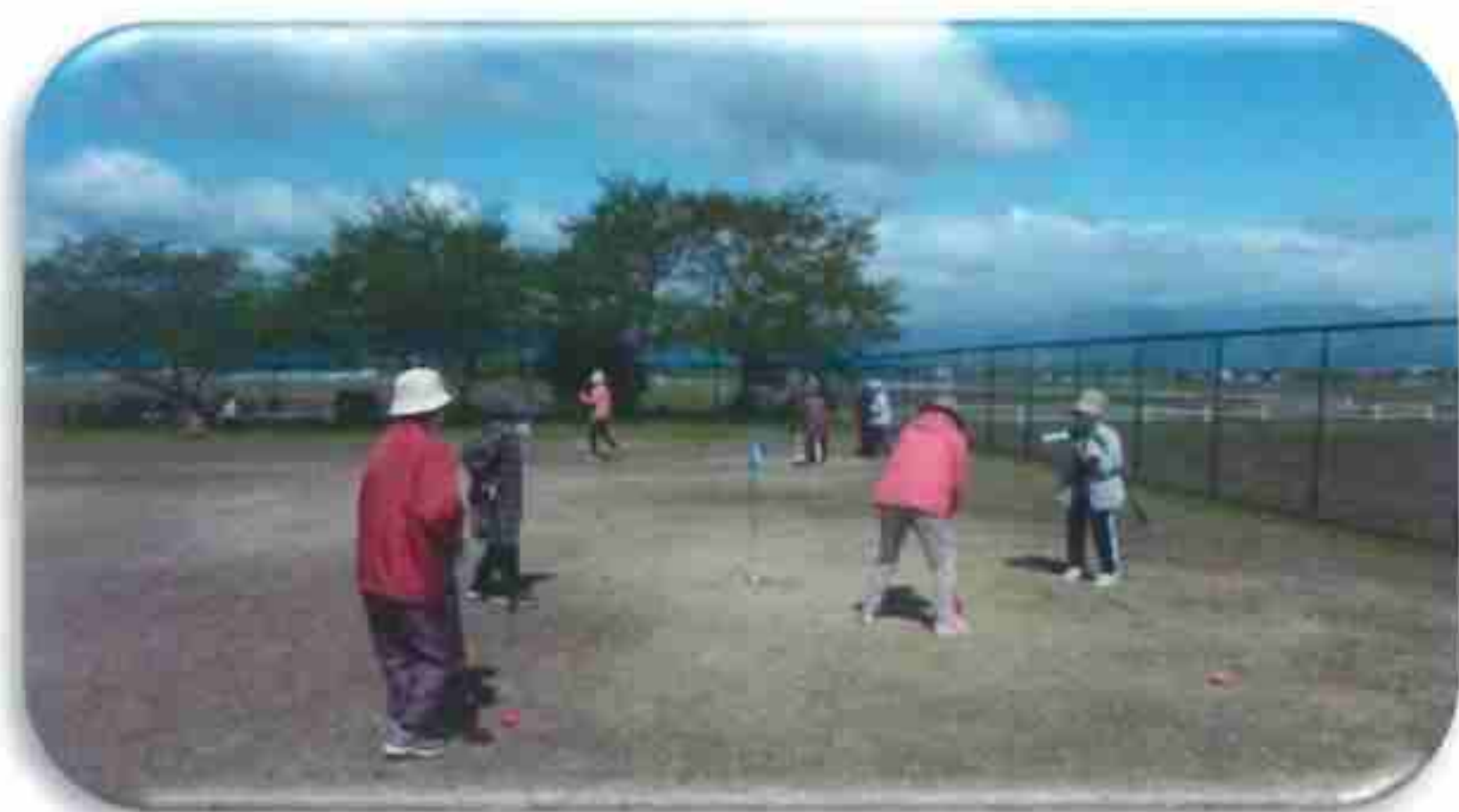
見晴らしのいい公園で グラウンドゴルフされています。

来年はいよいよ小津神社の例祭「なぎなた祭り」の当番が杉江に廻ってきます。松寿会としても、由緒ある伝統芸能の継承に遺憾なく今まで経験して得た知識を発揮したいと思います。