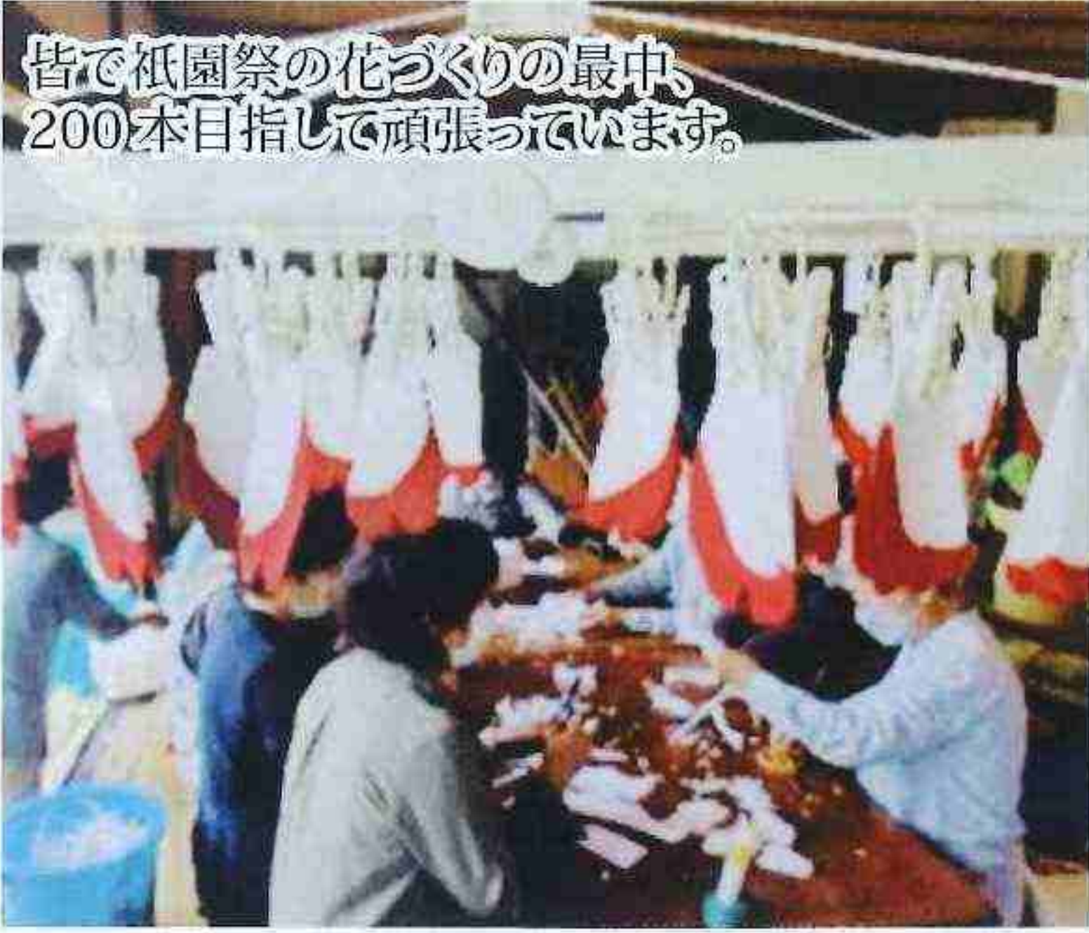
皆で祇園祭の花づくりの最中、200本目指して頑張っています。