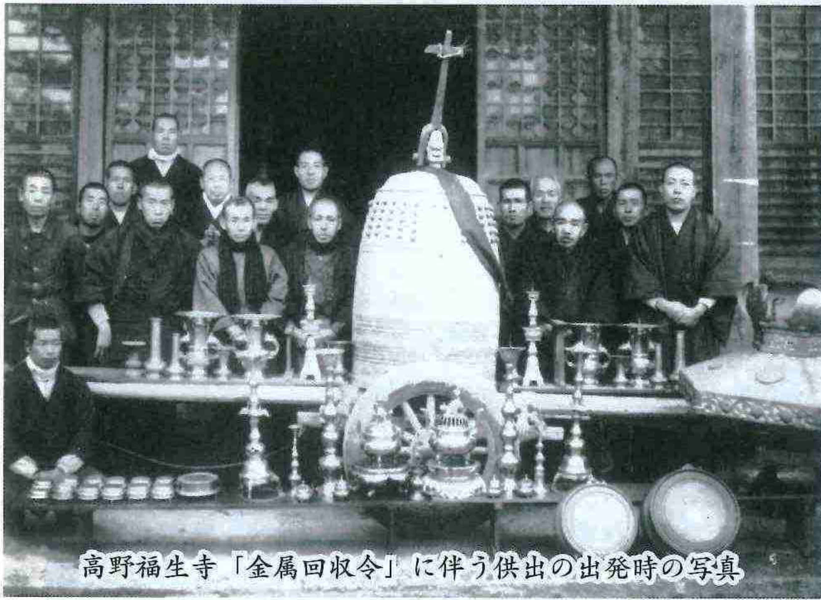
高野福生寺「金属回収令」に伴う供出の出発時の写真

数年前、地元で一枚の写眞が見つかり、裏に「昭和十七年、大東亜戦争で供出」と記されていたので、さらに調べると、この釣鐘は「寺庄村鑄物師北川若狭藤原慶貞作」となっていた。お隣の「寺庄村史」を調べると、寺庄村には江戸期から明治中頃までは現在の県立甲南高校敷地付近に鑄物座・鑄物師が活躍していた。近くの九ヶ所のお寺に釣鐘を納めた記録がある。早速、現物調査を行ったところ見事に全てが戦争で供出され、戦後になって、一代目の釣鐘が吊されていた。