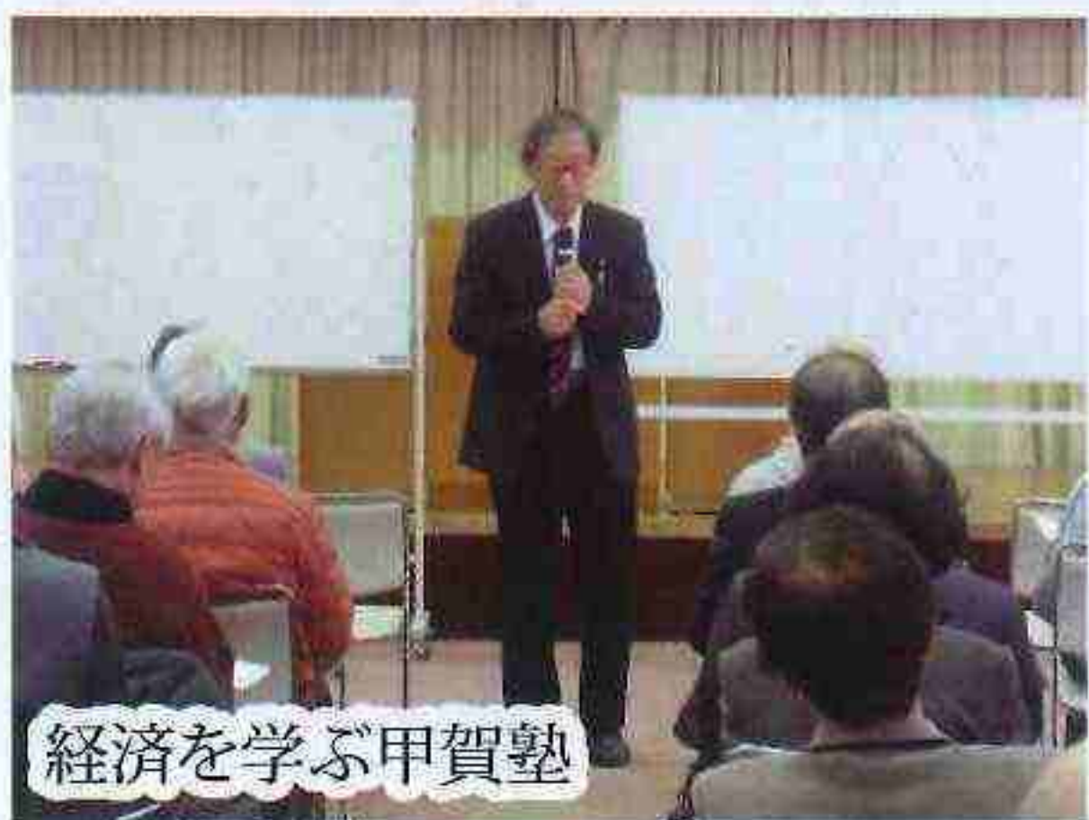
経済を学ぶ甲賀塾

ゆうゆう甲賀クラブ主催のゆうゆう甲賀塾は、今年も年間4回の講座が開かれています。甲賀市政、医療、健康、経済、落語等の各分野から、どんな内容にするかは、役員会で検討・決定し、各会員に受講募集をしています。