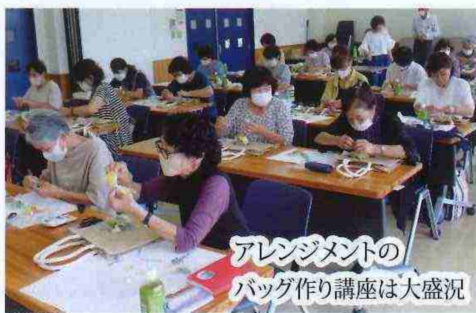
アレンジメントのバッグ作り講座は大盛況

何もかも未知数の私ではありますが、日頃何かと、ゆうゆう甲賀クラブの役員様各位のご指導のもと、広報誌の投稿を通して回想しております。