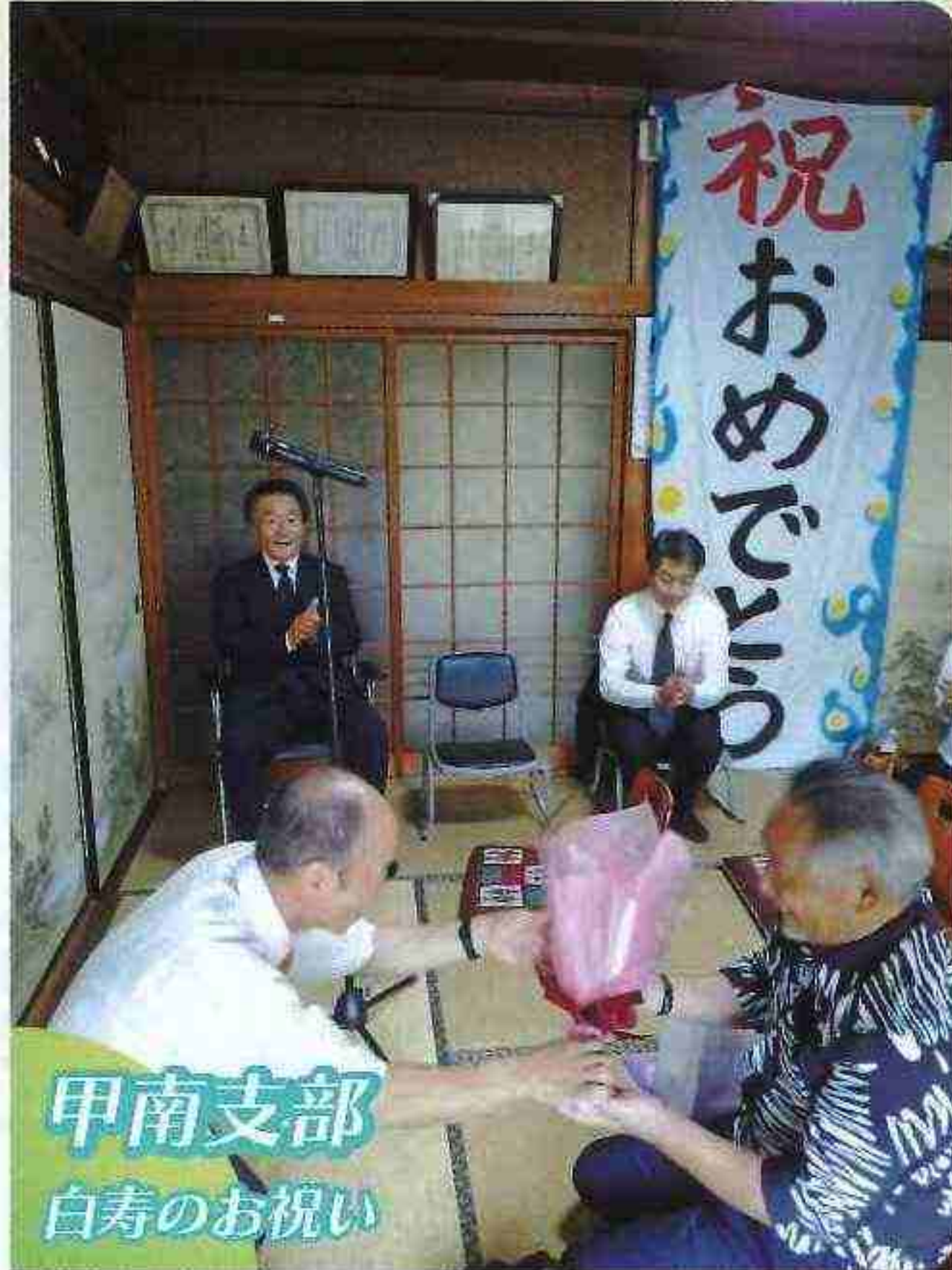
甲南支部 白寿のお祝い