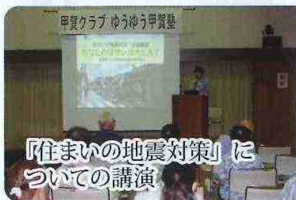
「住まいの地震対策」についての講演