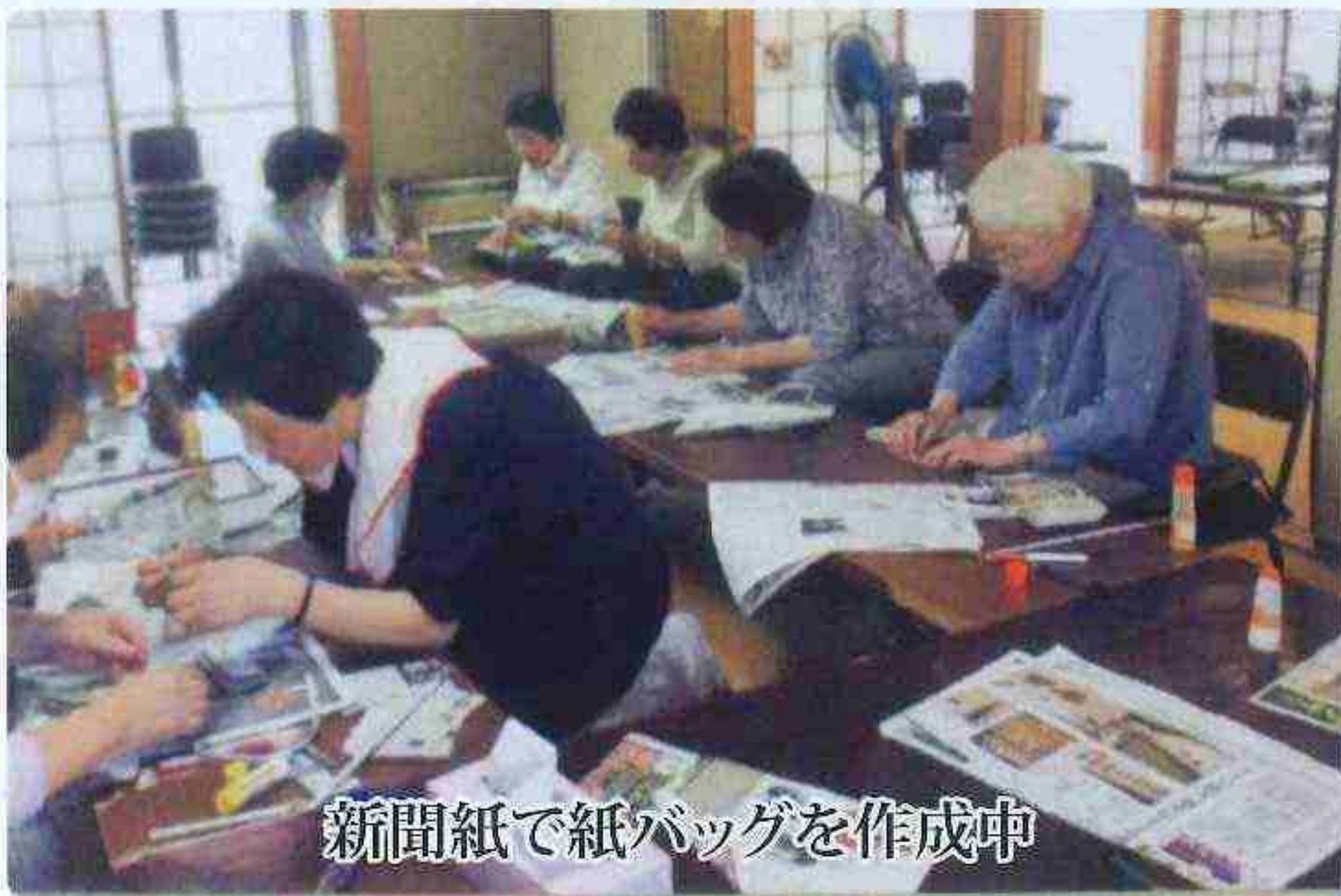
新聞紙で紙バッグを作成中