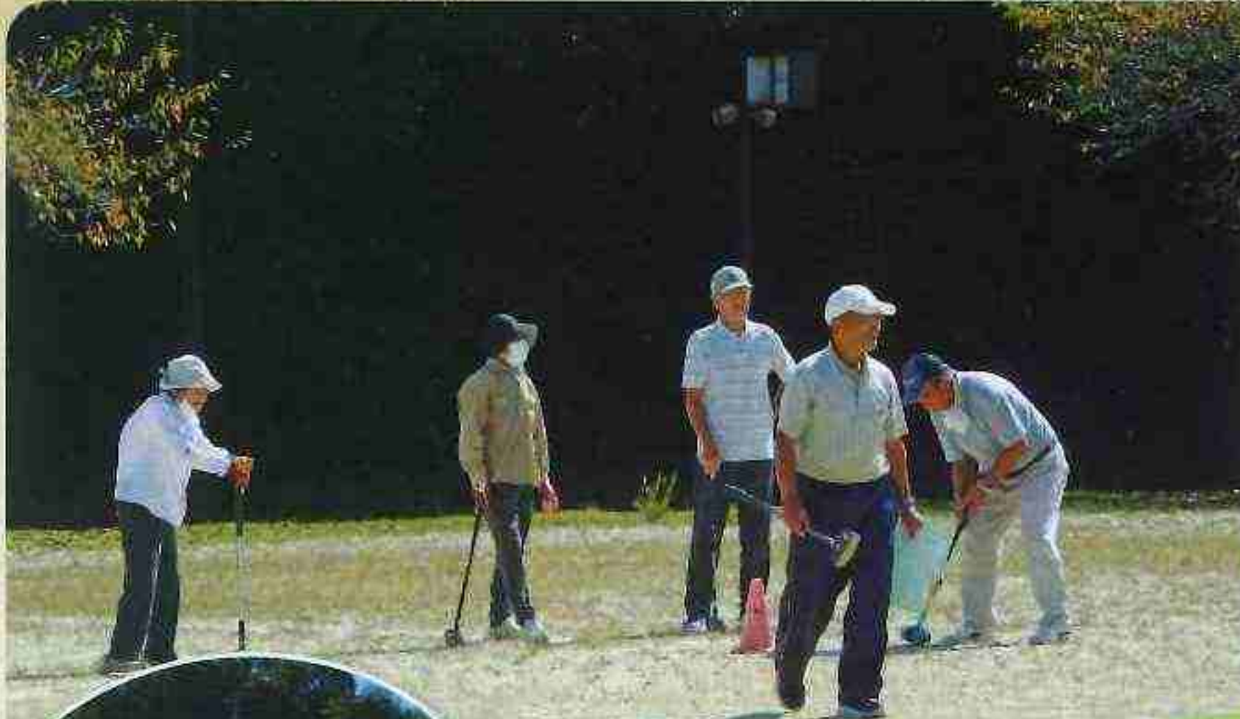
信楽支部 グラウンド・ゴルフ大会

発行者:ゆうゆう甲賀クラブ TEL・FAX:0748-62-6842 〒528-0051 滋賀県甲賀市水口町北内貴307番地 老人福祉センター碧水荘内