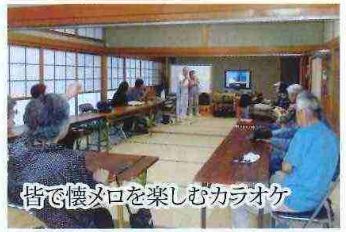
皆で懐メロを楽しむカラオケ