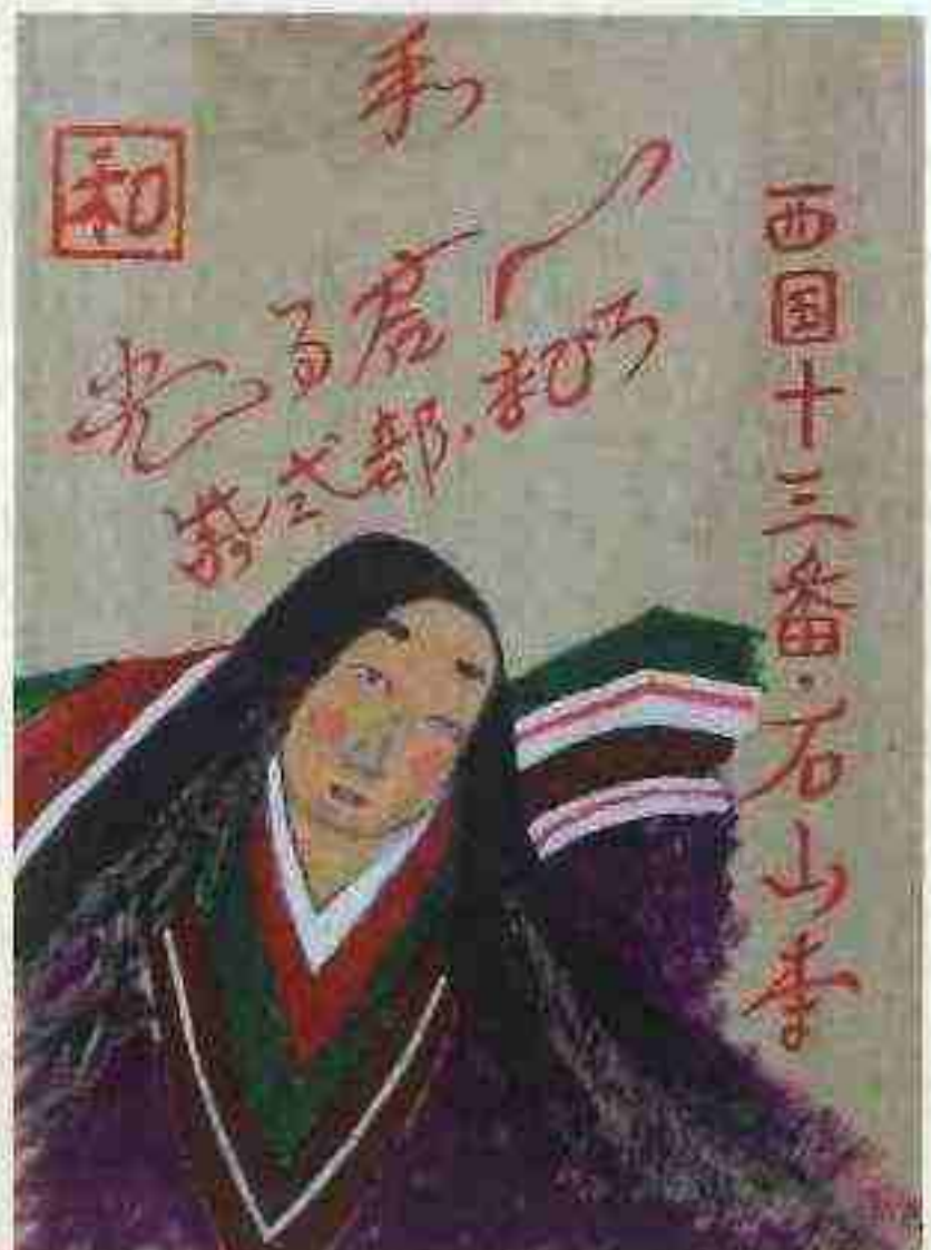
ペン画 〈甲南支部池田さんさんクラブ〉 奥村 喜代