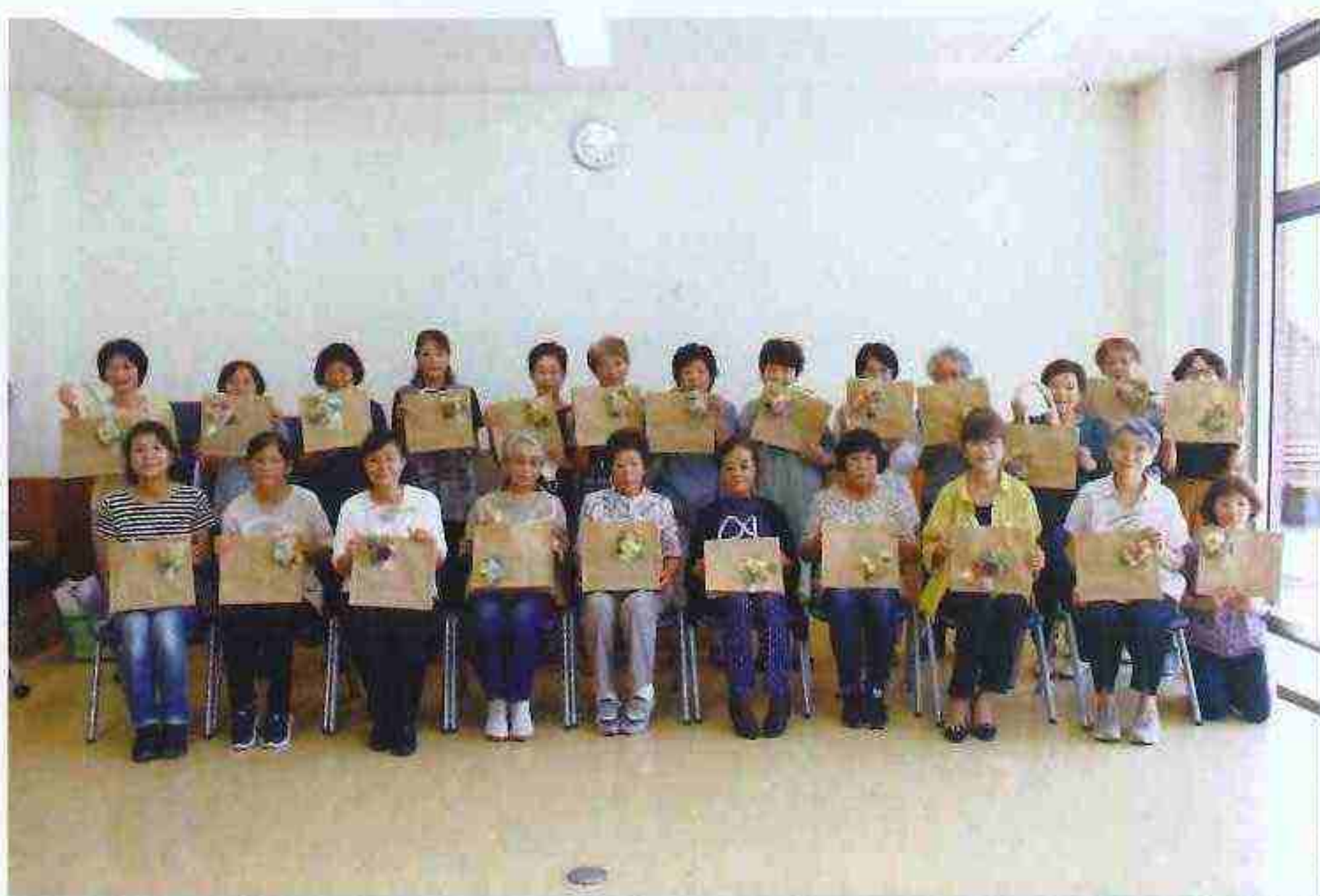
素敵なアレンジメントバッグが出来上がりました。

①メインテーマである「伸ばそう健康寿命！担おう！地域づくり」②基本方針では、現在、少子化による人口減少高齢化世帯の増加が進む中、組織活性化に努めるとともに「地域の安心・安全や福祉の支え手」として、「ゆとり、うるおい、や