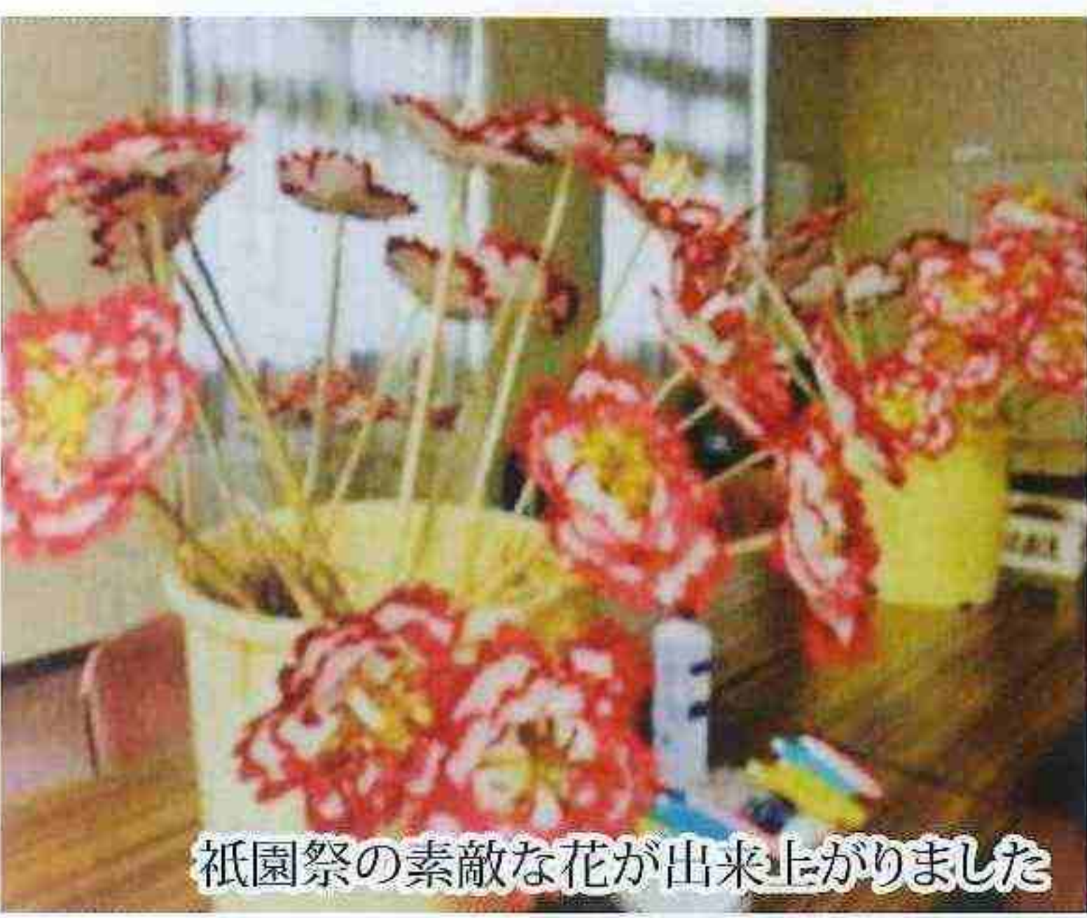
祇園祭の素敵な花が出来上がりました