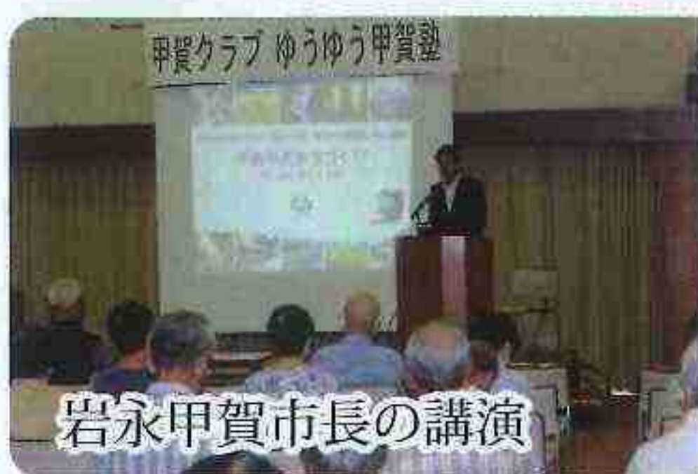
岩永甲賀市長の講演