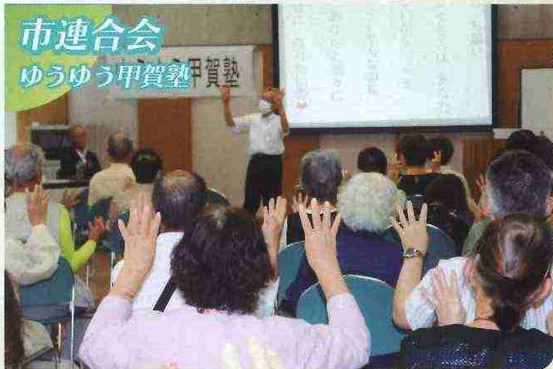
市連合会 ゆうゆう甲賀塾