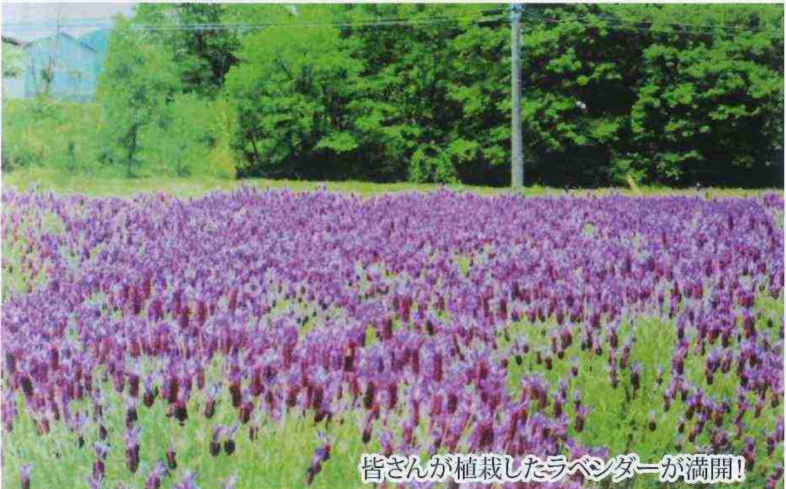
皆さんが植栽したラベンダーが満開!