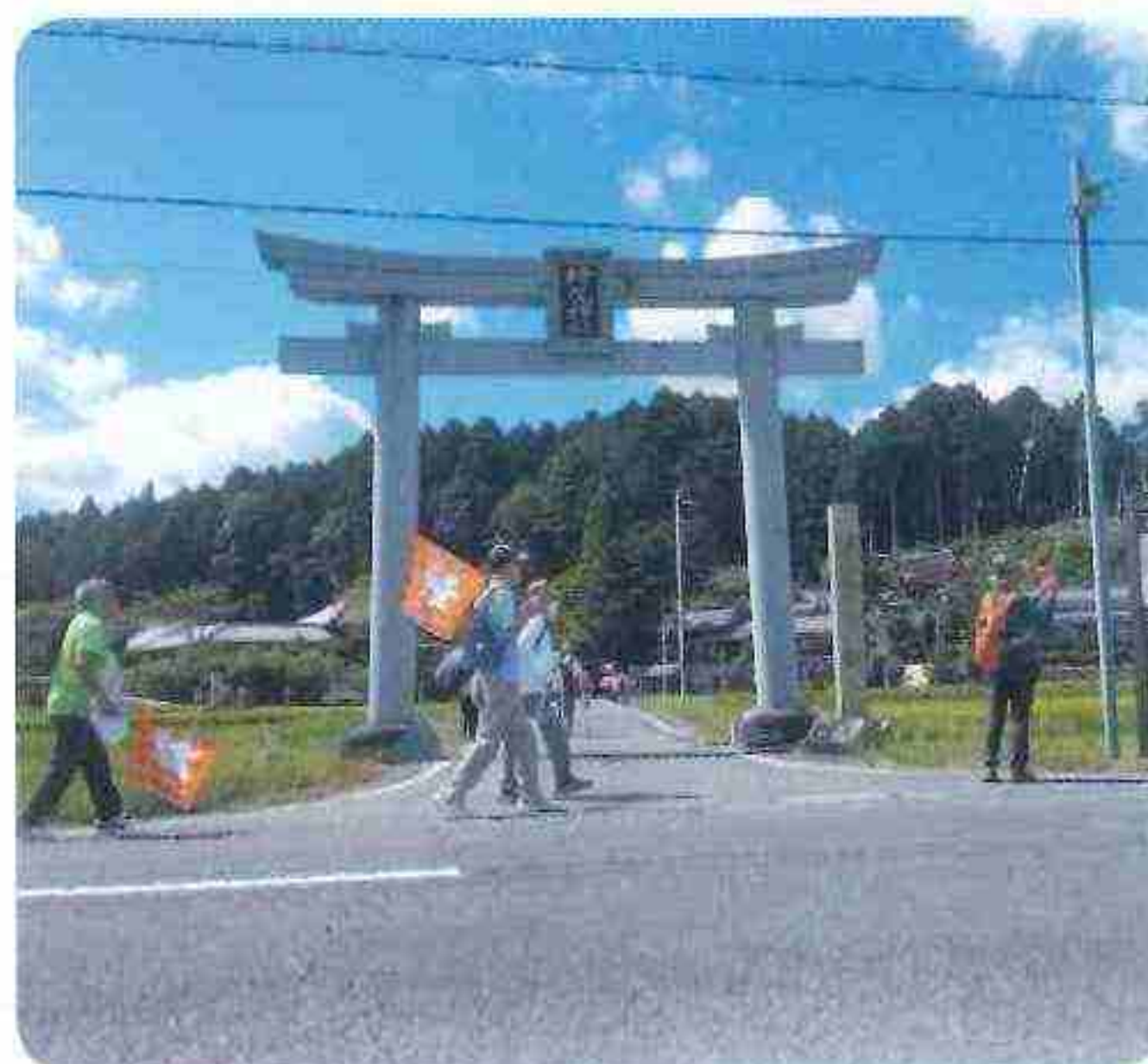
甲賀 檜尾神社 9/17