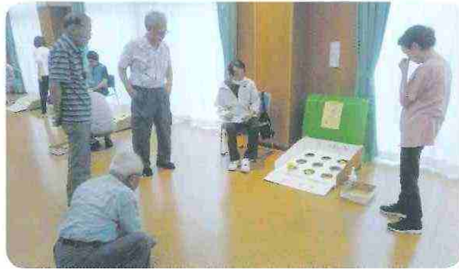
菩提寺・正福寺 ブロック 7/3