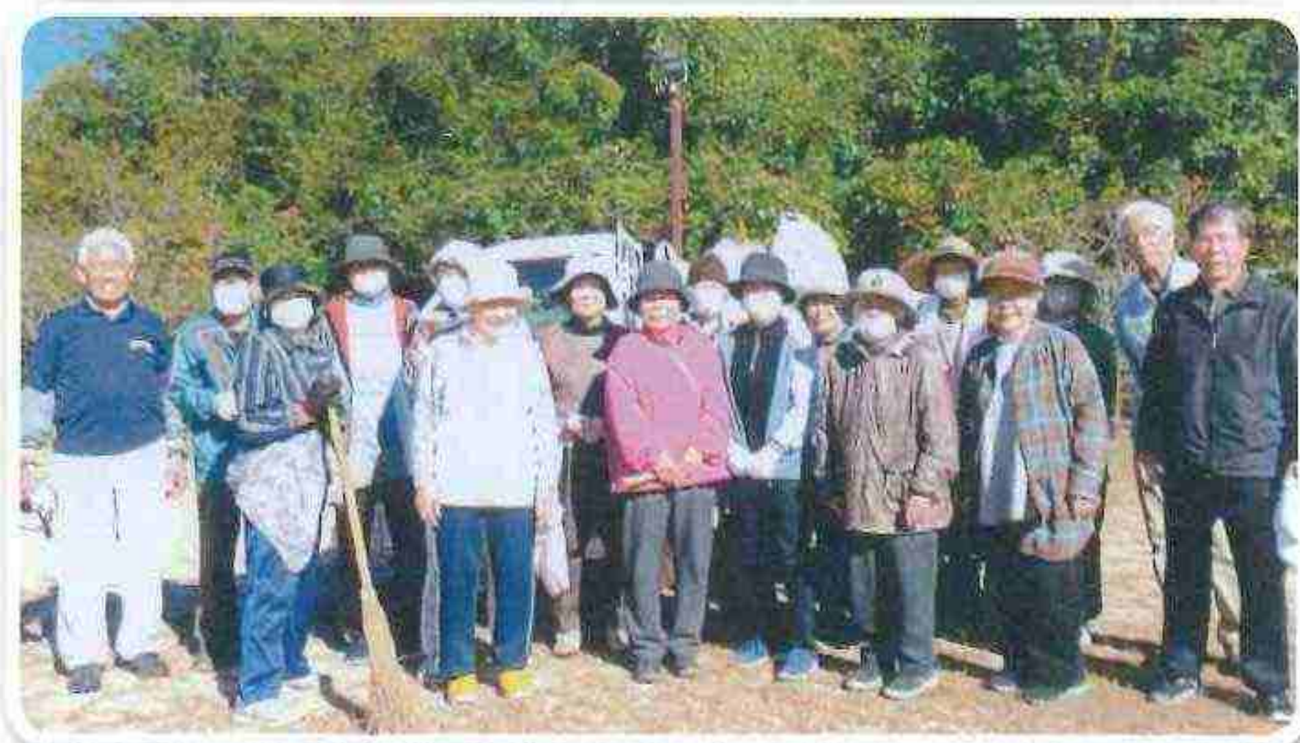
イワタニランド 菩提寺北広場

情報、アイデア等の連絡先 湖南省老人クラブ連合会 事務局 TEL/FAX 0748-72-2320