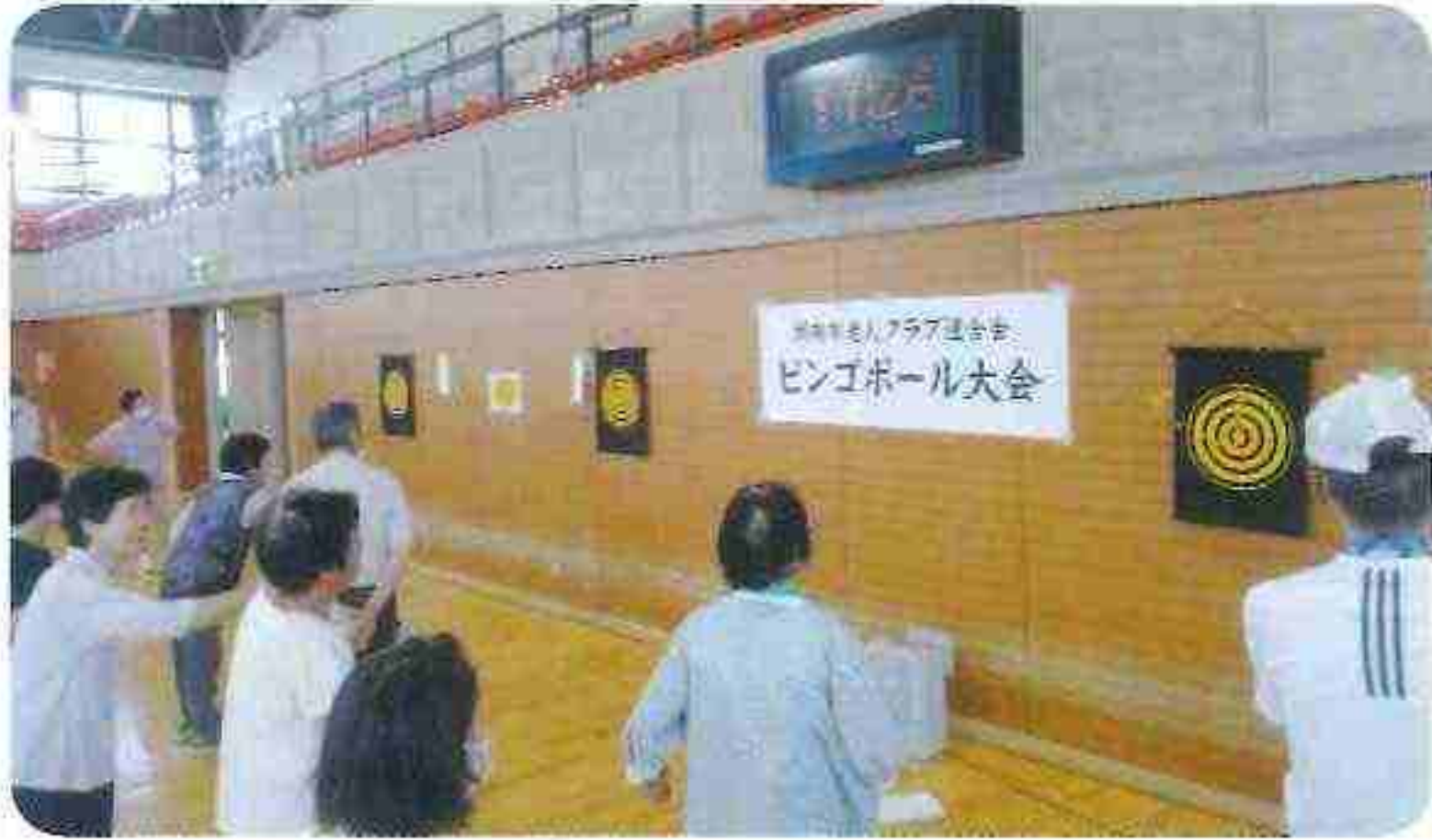
甲西中 ブロック 7/5