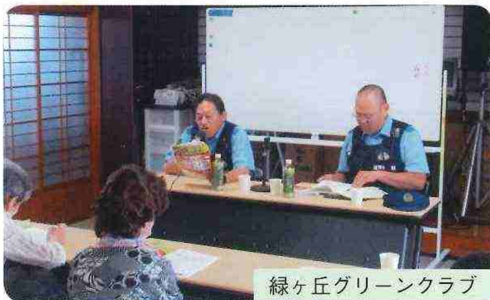
詐欺被害防止講話 7/22