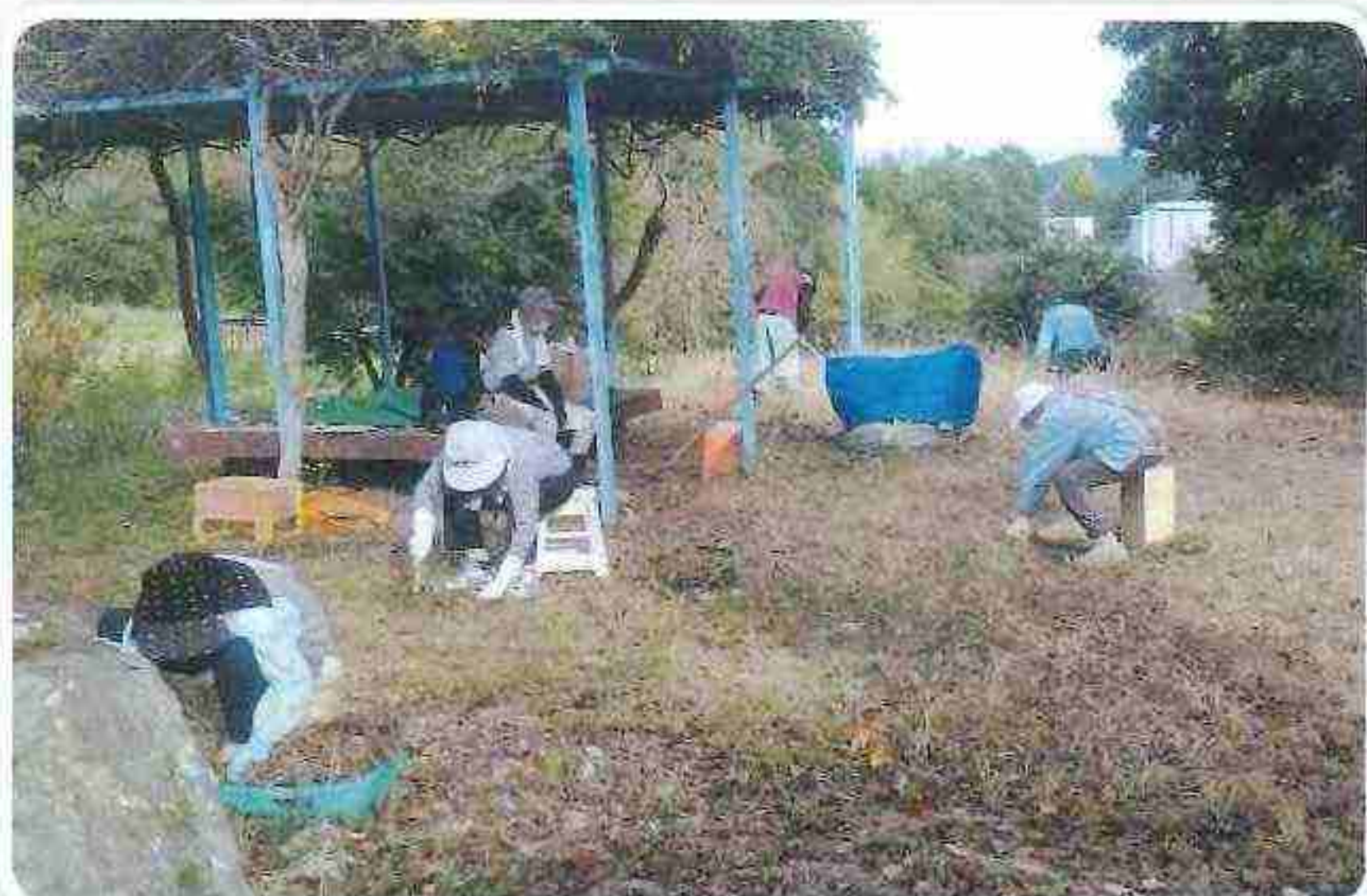
東寺 せせらぎ公園