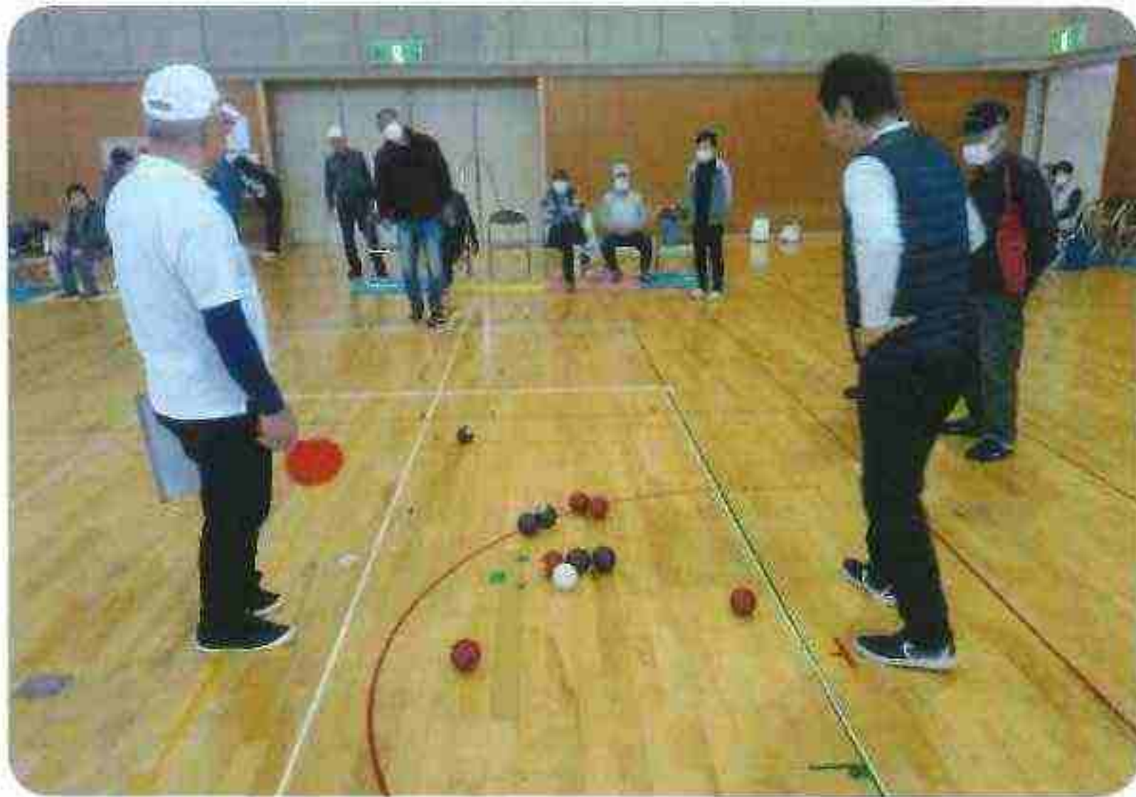
戦術・技術が重要です。