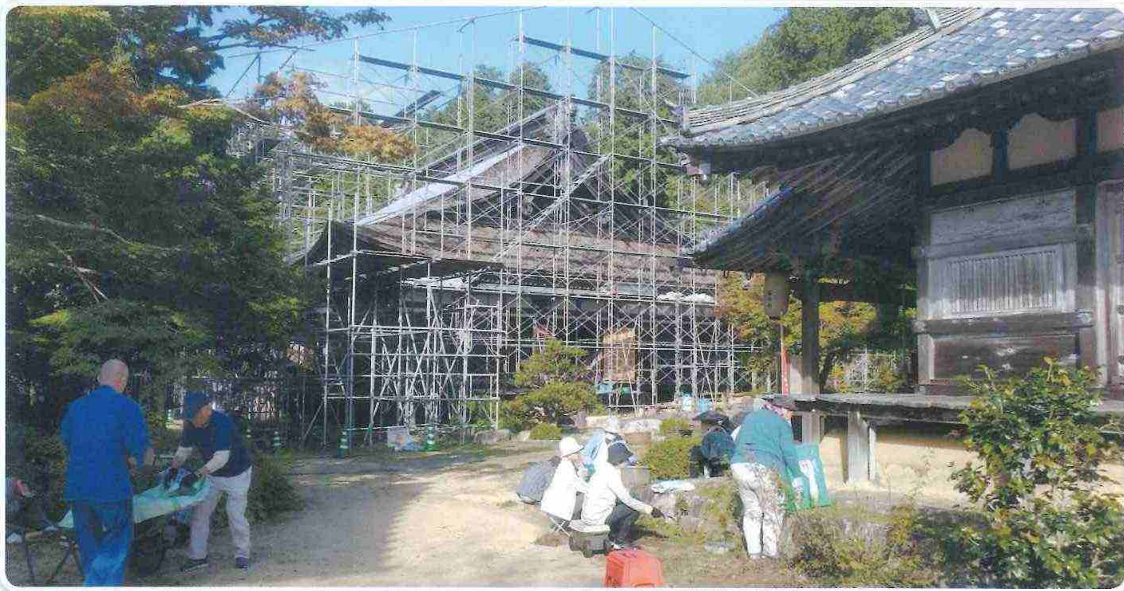
岩根東 善水寺さんは 屋根の修理の為、1年半ほど本堂の頬かむりをされます。