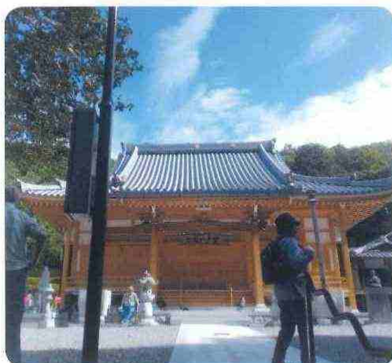
きれいになった正福寺ともゆき堂 10/15