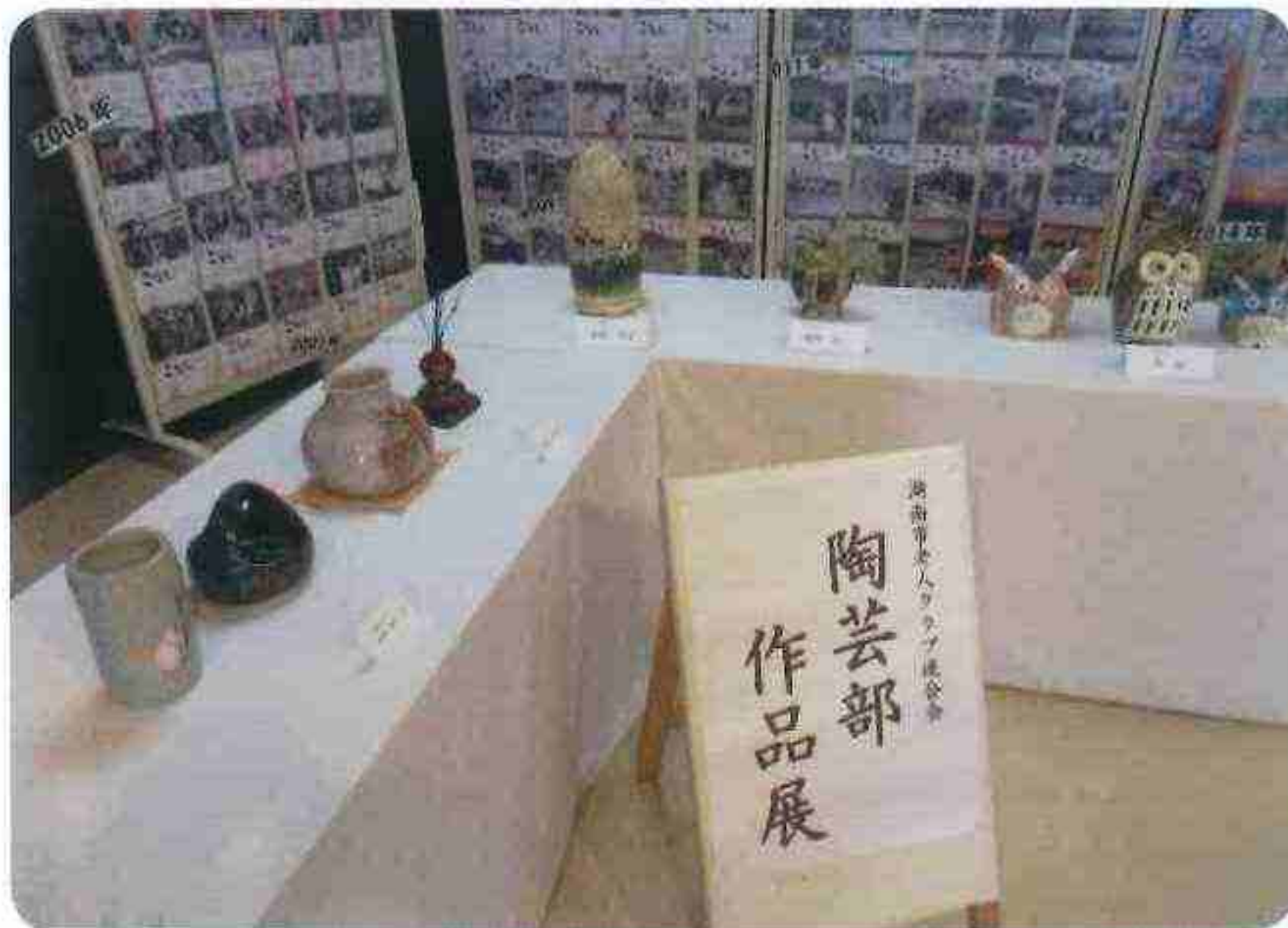
老ク大会での作品展示