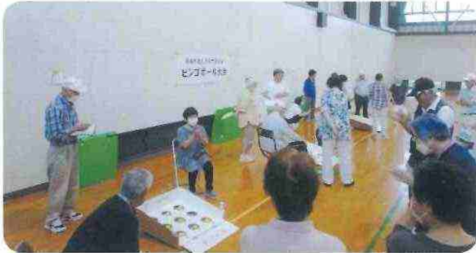
下田・岩根東 ブロック 6/28