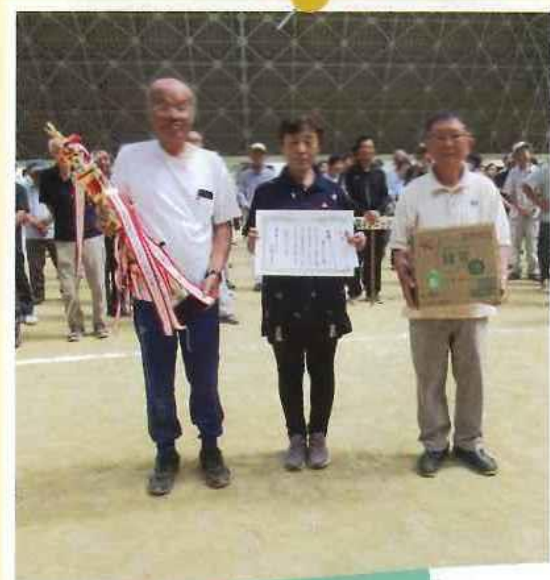
優勝：第4ブロック (林・庄)