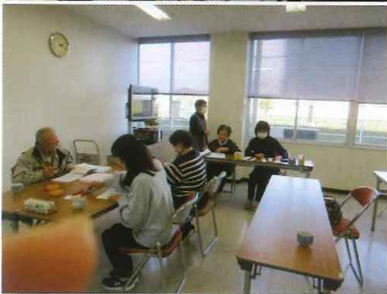
私たちは、竜王町老人クラブ連合会の活動を応援しています