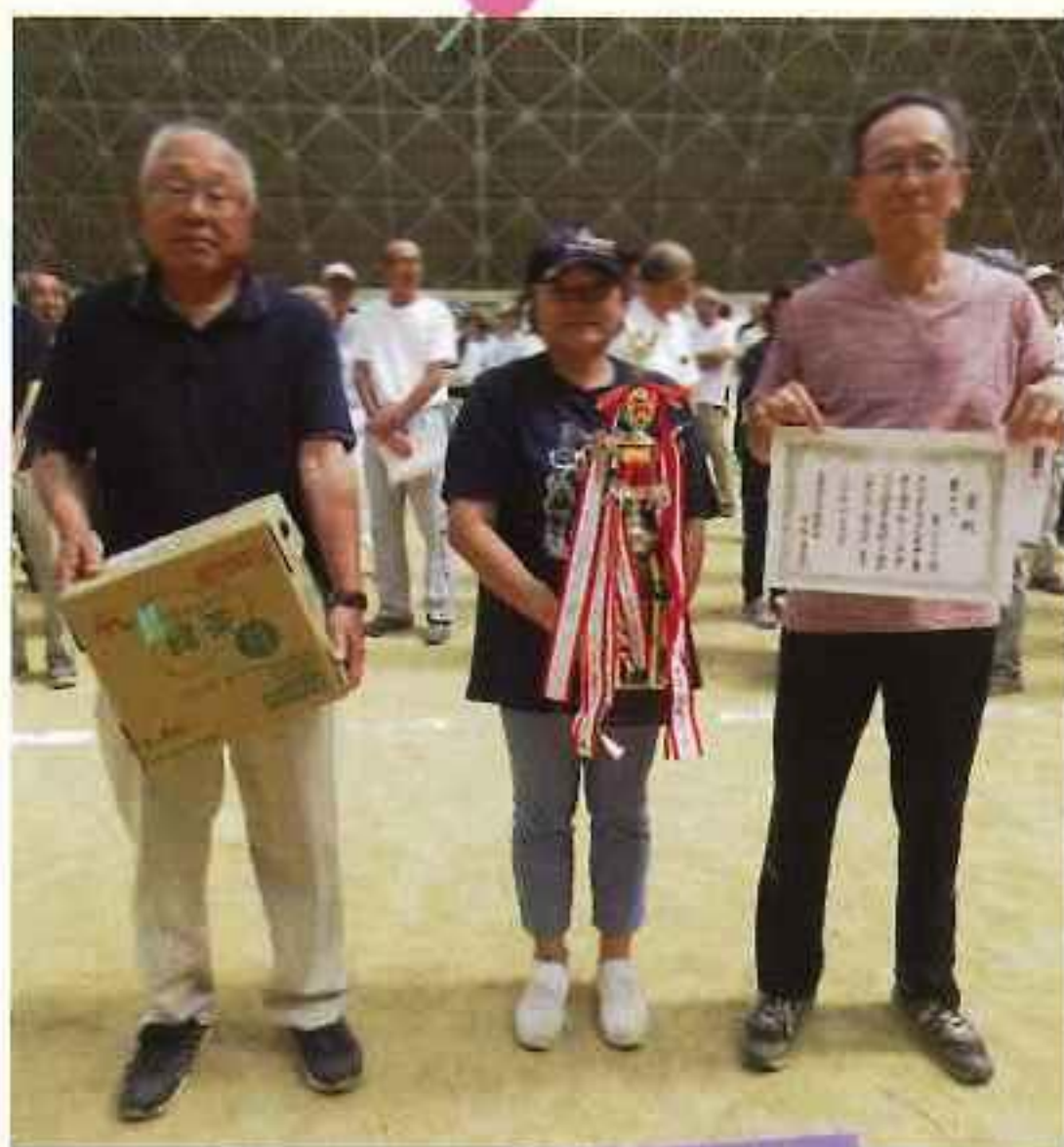
第3位：第8ブロック (東出・西出)