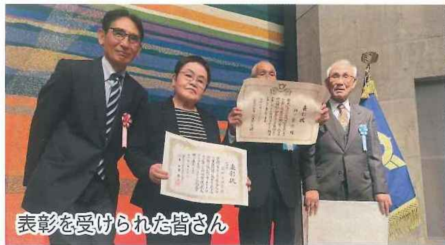
表彰を受けられた皆さん