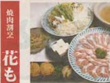
焼肉酒席 花もよう イベリコ豚 しゃぶしゃぶセット お風呂付き...4,950円

■ご宴会は平日のみです。3日前までのご予約承ります。(土・日・祝 応相談) ■4名様～100名様まで ■ご宴会団体様の無料送迎バス有り(片道30分以内5名～28名まで) ■詳細はお問合せ下さいませ。