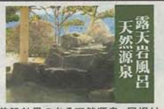
美肌効果のある天然源泉。屋根付の畳張りの休憩場は当館ならでは!