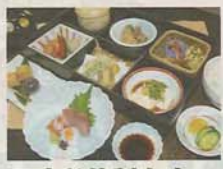
味彩特製弁当 お風呂付き...2,850円