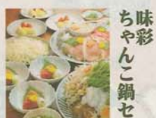
ち味彩 あじの鍋セット お風呂付き...4,950円