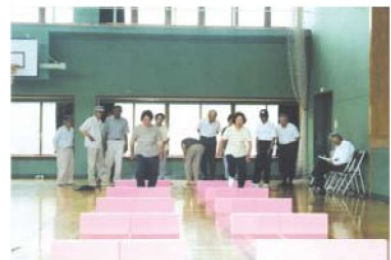
わたしたちは、びわこ豊熟シニアクラブの活動を応援しています