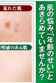
▲荒れた肌(ダメージ肌) vs 透明感のある肌(健康な肌)

「ほおの悩みが気になる...」お手入れしても薄くならない...その肌の悩みの原因は、年齢のせいだけでなく、陽射しや間違ったお手入れにもあるのです。昔から、お茶は美容に重宝され、お茶でお手入れすると素肌美人になると伝えられます。お茶には美容に良いというカテキンが含まれているのです。そのカテキン類タンニンは、鹿児島産の茶葉に多く、大変優れていると言われます。「茶のしずく」は鹿児島産の陽射しを受け、「茶匠」熊田氏の無農薬栽培法で育てたこだわりの二番茶のみを厳選使用。この茶葉だからこそ、悩みみ知らずの透明美肌へ導く理想の泡洗顔を実現できるのです。さらに、天然由来の有効成分「甘草由来グリチルリチン酸2K」で肌荒れを防ぎます。茶葉の美肌力が溶け込んだ悠香のお茶石鹸「茶のしずく」ぜひお試しください。