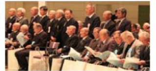
昨年の表彰者紹介風景