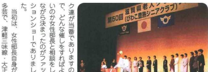
当初は、女性部長自身が多芸で、連舞三味線・大正

しかし、ここまでに至る経過は大変なものでした。第四ブロックは栗原市と愛知・犬上郡が合併して成り立っており、また、ところでブロック制が決まるまでは愛知・犬上土地は単独で行動し、行事も単独で行っていました。栗原市と合併後も参加人員の收容能力の問題等々では従来通り列々の行動をせざるを得なくなっております。