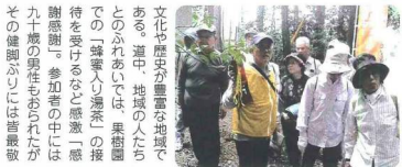
文化や歴史が豊富な地域である。道中、地域の人たちとのふれあいは、果敢道での「蜂蜜(い)湯茶」の接待を受けるなど感謝一感謝感謝。参加者の中には九十歳の男性もあられたが、その健闘がけには皆驚歎

去る十月三十日(火)あけいウォーキングが開催されました。参加者は約二十人、栗原市には多くの文化財や旧跡が各地に点在しています。このコースは、江戸幕府より旧東海道を沿って旅人の宿所として立地茶屋が建ちた岡地区を起点として周辺約六キロメートルを歩くコースである。本コースは、奈良時代から平安時代の栗太郡役所跡・土壇、神社や城跡等の