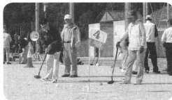
ゴルフ大会の様子

一組五、六名の全六組がA、Bに分かれてコースを回り、一昨年が開設されたばかりの自然溢れる広大な緑の公園であるゴルフコースと整備された、ゴルフクラブに最適な気候の中、のびのびとプレー、爽やかな汗を流しました。時折強く風にあおられ、ボールがコースをは